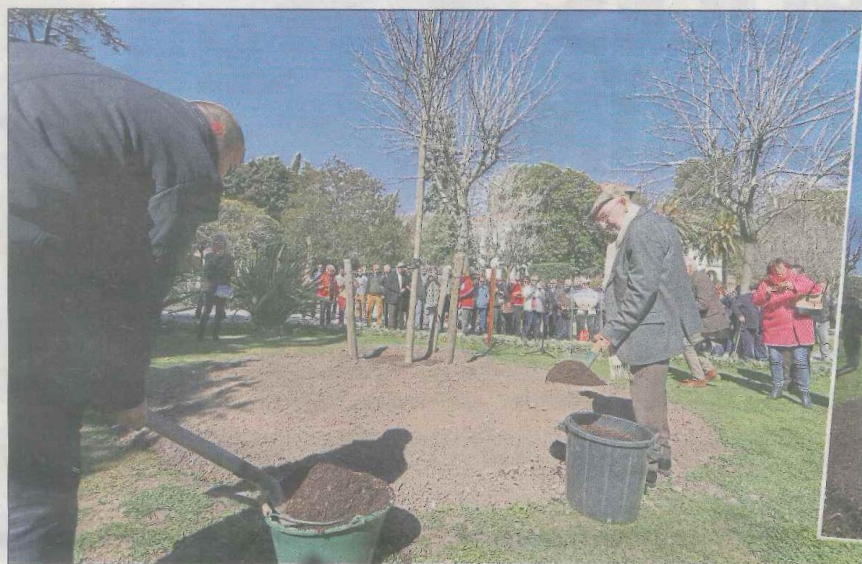
Quel meilleur symbole qu'un arbre que l'on plante pour marquer une amitié vieille de 240 ans entre les deux pays, et âgée de trente-neuf ans entre les villes de Fredericksburg (Virginie) et Fréjus ?